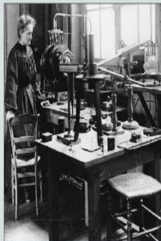
Marie Curie dans son laboratoire.

En 1898, Pierre et Marie Curie reçoivent le Prix Nobel de Physique pour leurs travaux sur la radioactivité. Après la mort accidentelle de son mari en 1905, Marie Curie continue ses travaux, isole le radium et reçoit le Prix Nobel de Chimie en 1911.